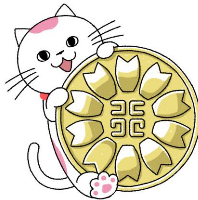
日本行政書士会連合会 公式キャラクター ユキマサくん