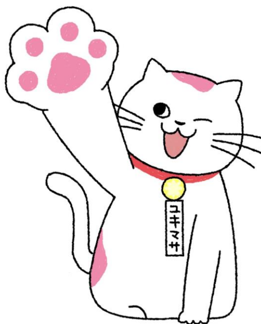
日本行政書士会連合会 公式キャラクター コキマサくん